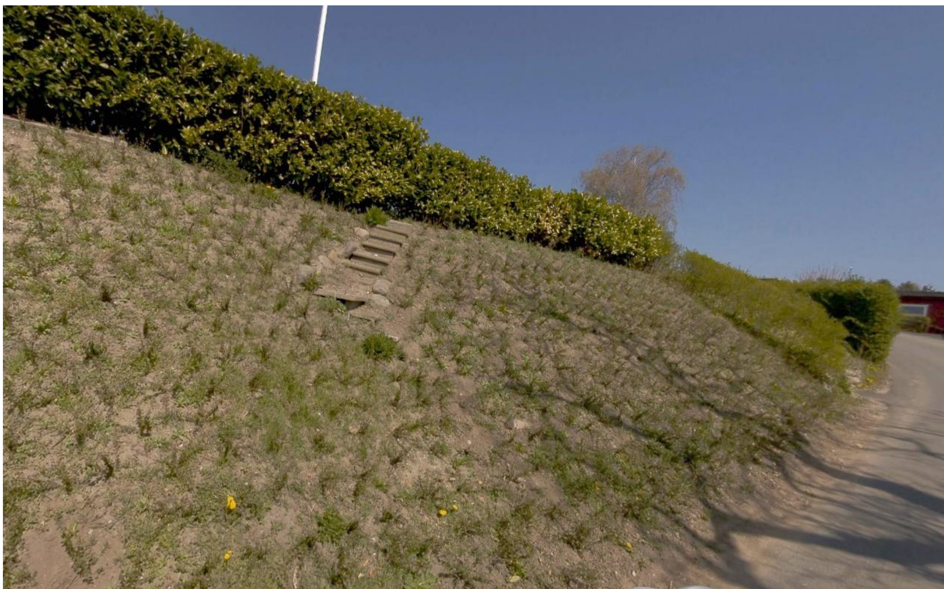
Skrænt for Violvænget 7 med delvist nedlagt trappe.