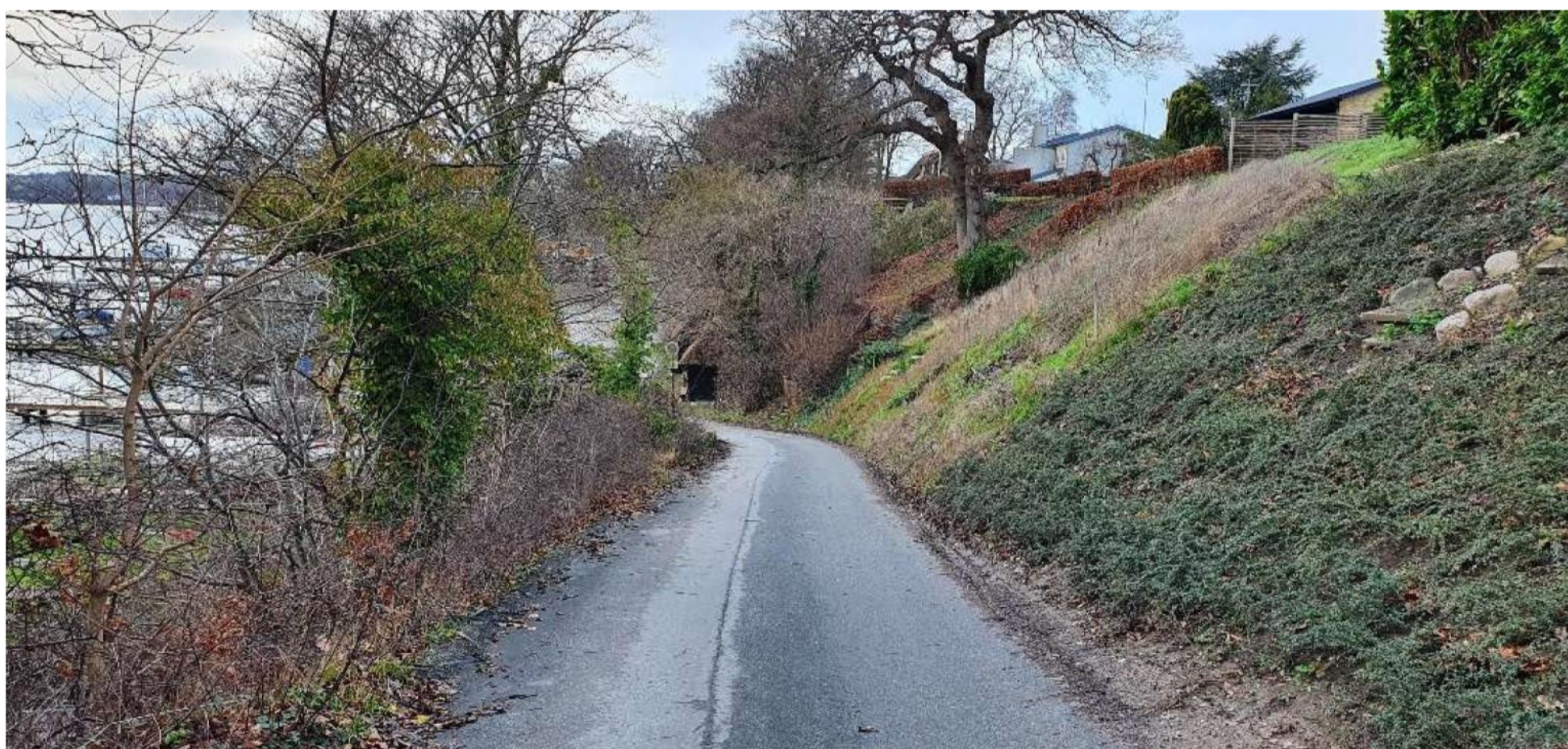
Gambøtvej set oppefra midt på den sydligste strækning. Til højre ses skrænt for hhv. Violvænget 7, 9 og 10.